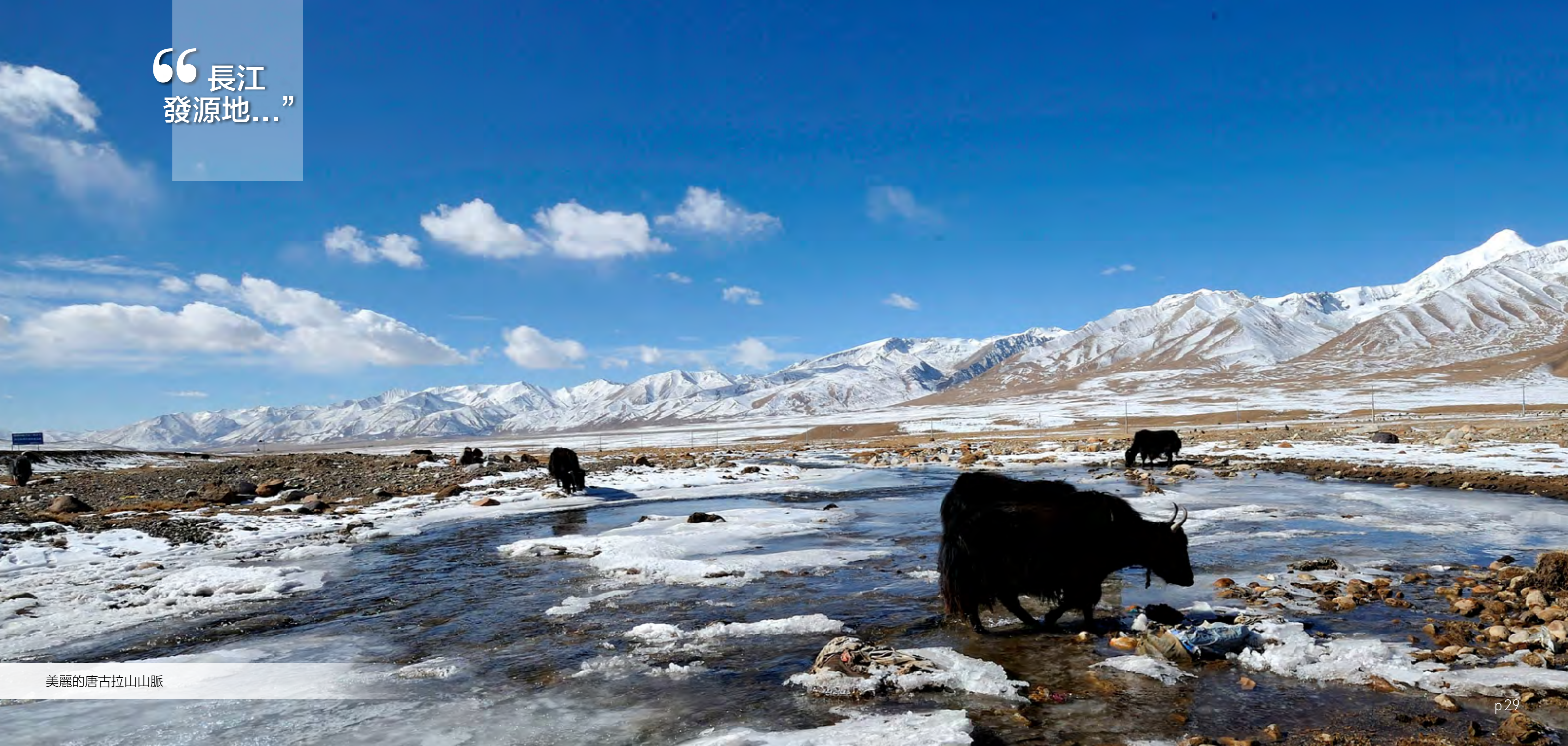
美麗的唐古拉山山脈