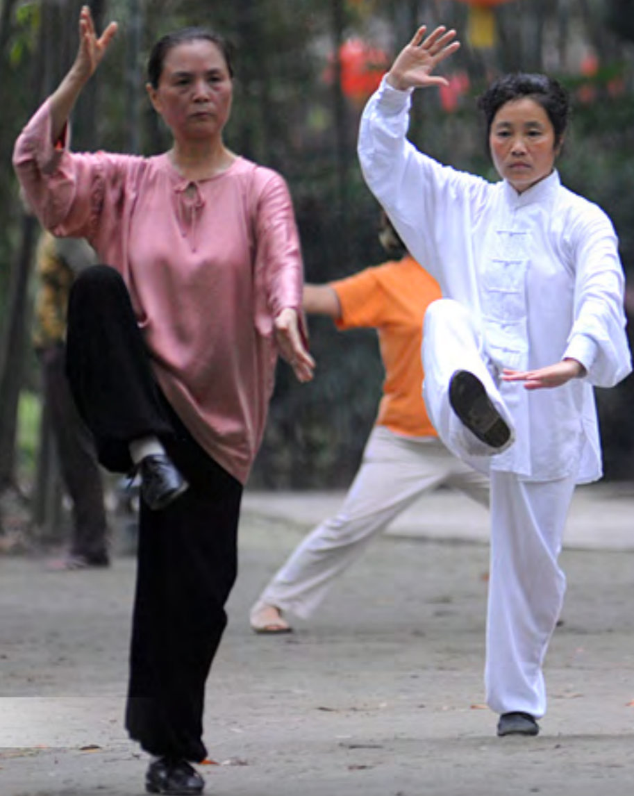
歡迎來到成都，當地人在公園竹林練習拳藝