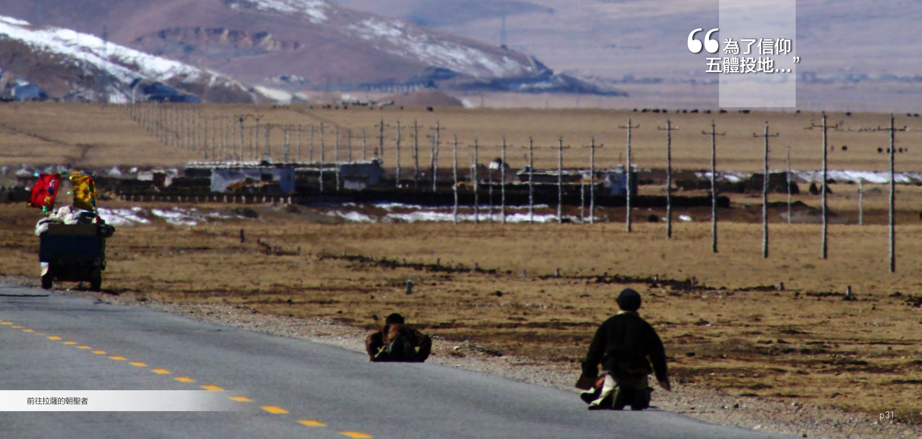
前往拉薩的朝聖者