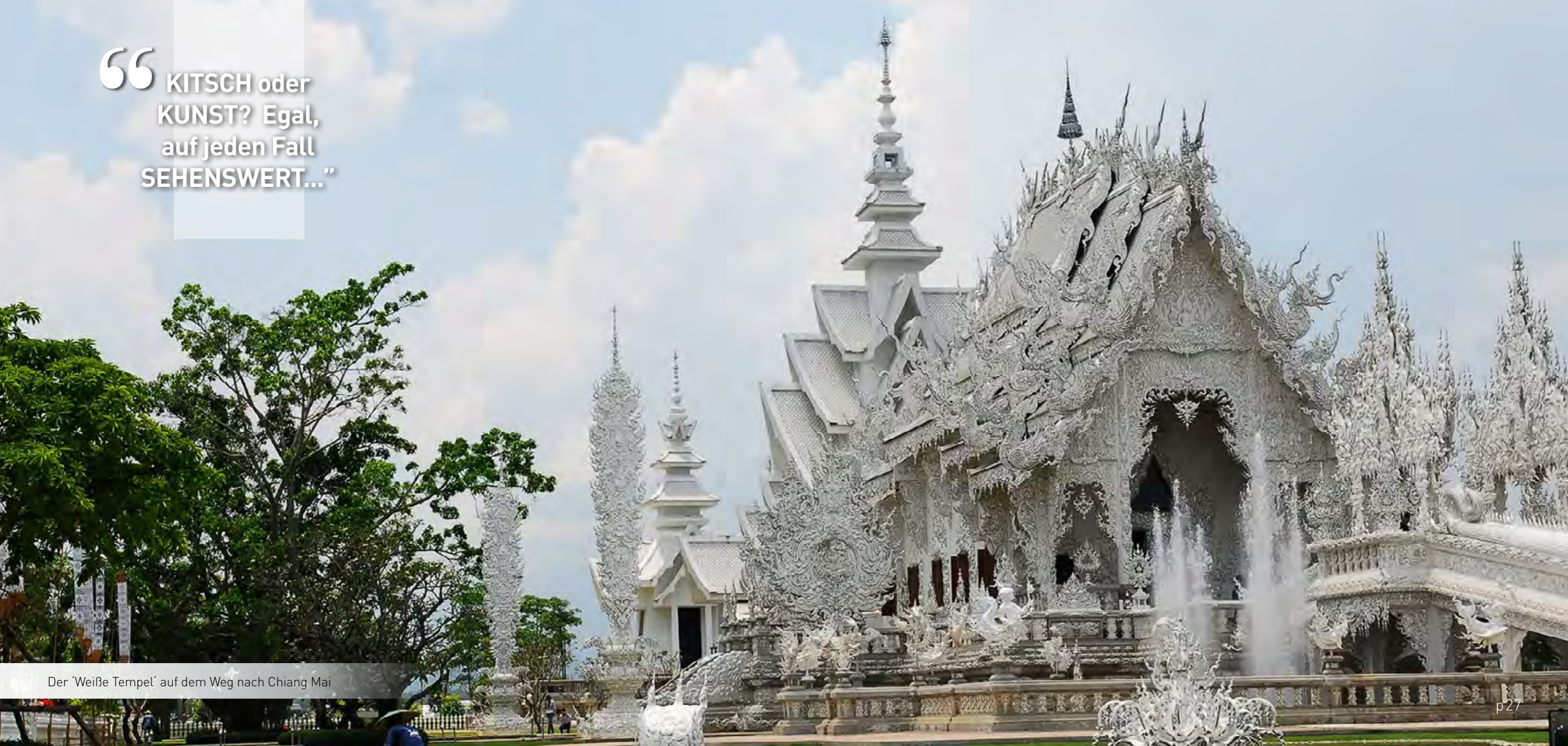
Der 'Weiße Tempel' auf dem Weg nach Chiang Mai

“ KITSCH oder KUNST? Egal, auf jeden Fall SEHENSWERT...”