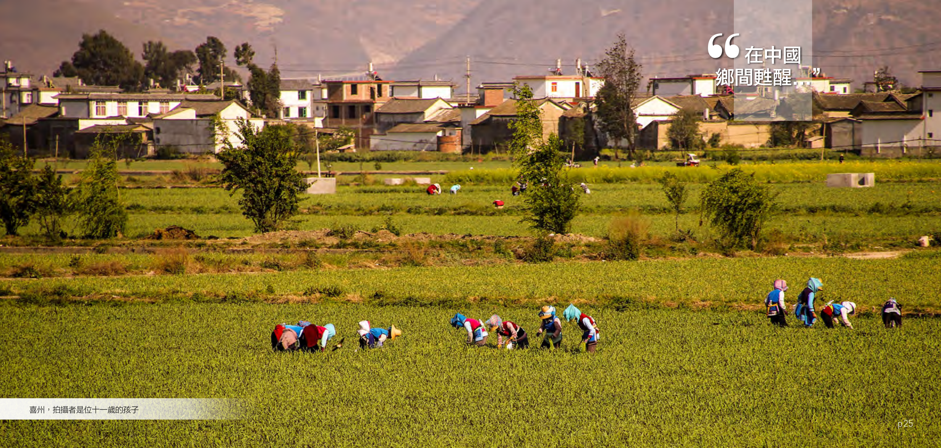
喜州，拍攝者是位十一歲的孩子